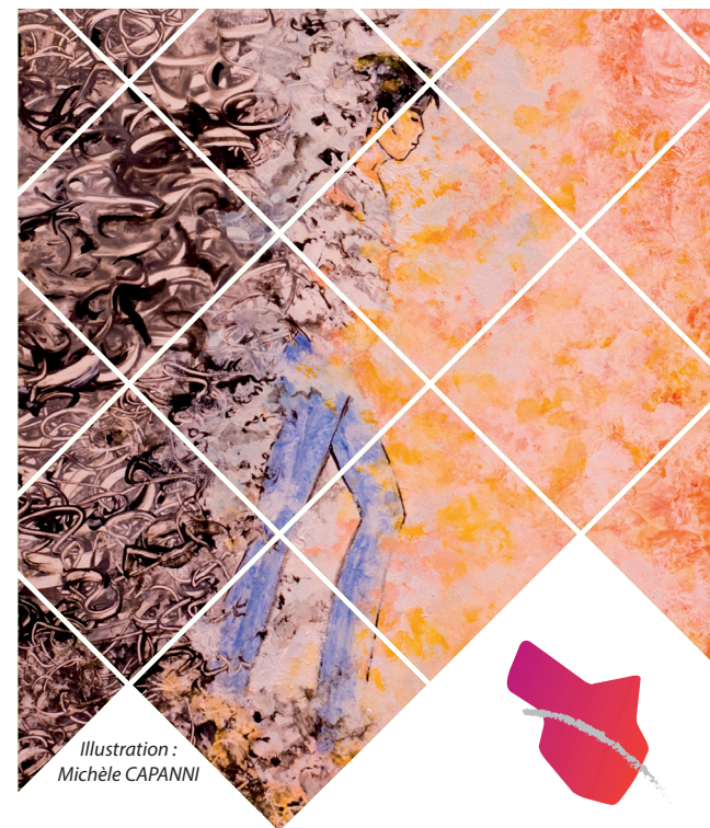
Illustration : Michèle CAPANNI

Site du Hasenrain - Pavillon 3 87, Avenue d'Altkirch - 68051 Mulhouse 03 89 64 70 92